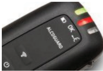
Toute l'actualité en image

D'après une récente étude menée à l'échelle européenne* par l'assureur en ligne Ineas, 42% des Français se déclarent 'pour' une tolérance 0 lorsqu'il est question d'alcool au volant et 12% se disent favorables à une limite plus basse que la limite actuelle de 0,5 gramme d'alcool par litre de sang. En Allemagne, aux Pays-Bas et en Espagne, la majorité s'exprime également en faveur d'une législation plus sévère sur le taux limite d'alcoolémie. 'Cela montre une prise de conscience et une responsabilisation croissante de nos clients concernant les dangers de l'alcool au volant et nous ne pouvons que nous en réjouir' conclut Stéphane Favaretto, responsable du marketing France chez Ineas.